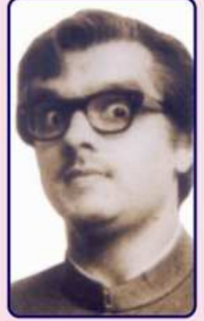
મન મોજીલા નાટકમાં

પણ પળ બદલાતા સમય સાથે મારા સ્વાંગ પણ બદલાઈ રહ્યા છે. હું ક્યારેક 'કલાપી' નાટકમાં લાઈનો મહારાજા કલાપી છું તો ક્યારેક 'અમારી દુનિયા, તમારી દુનિયા' નાટકમાં માત્ર અંતમાં દેખાદેતો બૂટપોલિશ કરવાવાળો રાજા છું. 'કાનજી વિરુદ્ધ કાનજી'માં સામાન્ય માનવીને દેખા દેતો અને ધર્મગુરુઓને નાચ નચાવતો મો.ડર્ન કૃષ્ણ પણ હું જ અને 'પ્રમેય'માં અસામાન્ય પ્રોફેસર તરીકે ગણિતની ગણતરીઓમાં જીવનનો હિસાબ ચૂકી ગયેલો આઘેડ વયનો સામાન્ય પિતા પણ હું જ. ક્યારેક હું અભિનેતા છું તો ક્યારેક દિગ્દર્શક પણ છું. દિગ્દર્શક તરીકે લેખકના વિચારોને વાચા આપવી અને પાત્રમાં આરોપાયેલી ભાવનાઓને જીવંત બનાવવી. મંચ પર એ જ મારું ધ્યેય. વિવિધ પાત્રો, રંગમંચ પર વીતતી દરેક ક્ષણ મારા જીવનનું અભિન્ન અંગ બની છે. ૧૯૮૩થી શરૂ થયેલી કલાયાત્રા દરમિયાન નાટ્યકલામાં આવેલા અનેક પરિવર્તનનો હું સાક્ષી બનતો રહ્યો છું. એ અનુભવને આધારે જ કહી શકું છું કે પરિવર્તન માત્ર સંસારનો જ નહીં, નાટકનો પણ નિયમ છે. પરિવર્તન થકી નાટકની રસિકતા જળવાઈ રહેતી જોઈને મને નવીન પ્રકારના નાટ્યપ્રયોગો હંમેશાં આકર્ષિત કરતા રહ્યા છે.