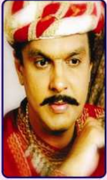
કવિ કલાપી રૂપે