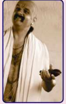
નરસૈયાનો નાથ નાટકમાં