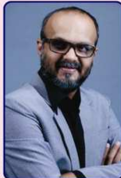
મેડ ઇન ઇન્ડીયા નાટકમાં