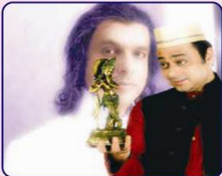
કાનજી વિરુદ્ધ કાનજી નાટકમાં