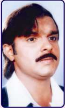
પ્રેમ ઘેરૈયા નાટકમાં

રંગમંચ પર મારો પ્રવેશ થયો. ભારતીય વિદ્યા ભવન-કલાકેન્દ્ર અને આઈ.એન.ટી.ની ઇન્ટરકોલેજિયેટ ડ્રામા કોમ્પિટિશનથી, એકાંકીનું નામ, 'ગઘે પે નિકલી સવારી' અને સરપંચનો રોલ. નાટક ફાઈનલ્સમાં સિલેક્ટ થયું. પહેલી વાર નજર સામે, હોલને પ્રેક્ષકોથી ખીચોખીચ થતો જોયો. કલાના કદરદાનોની તાળીઓ નાટકને જિતાડી ગઈ અને હું નાટ્યજગત પર દિલ હારી બેઠો. તાળીઓની ગુંજ મારી પ્રેરણા બની. સ્પર્ધા જીતતાં જ એકાંકીના ૫૦ શૉ ગોઠવાયા અને નાટ્યકલા મારું કાર્યક્ષેત્ર બની ગયું.