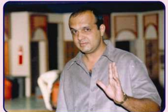
નાટ્યકલાના બધા પાસાંના કસબી