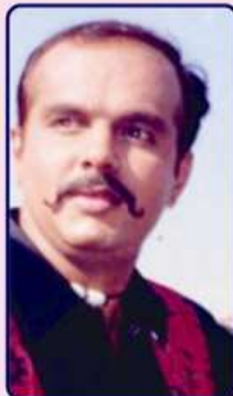
દરિયા છોરૂ કિલ્મમાં